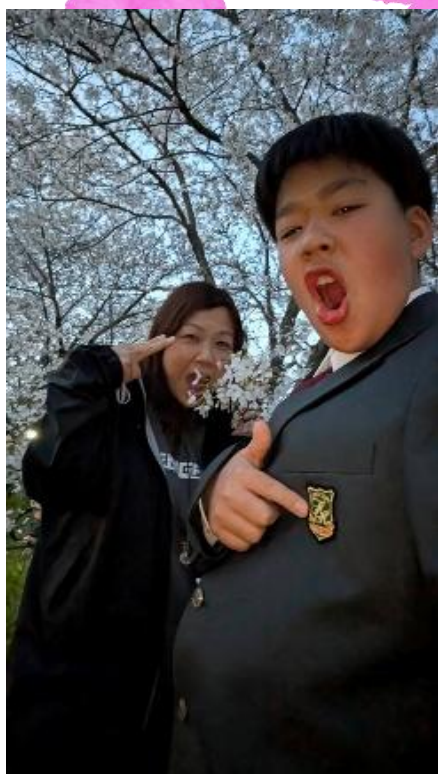
秀作：『桂川の桜とピカピカの1年生』