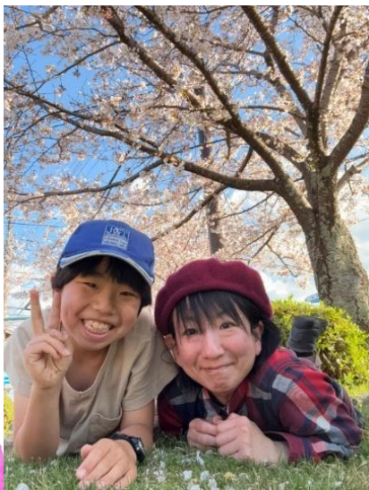
金賞：『清涼寺前の公園にて』