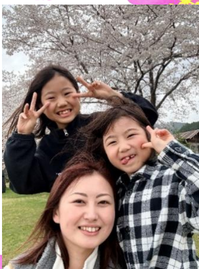
佳作：『栃本河川公園の桜』