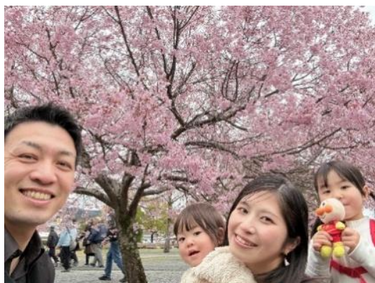
銀賞：『奈良県天理市の桜』

昨年に続き、この春も社内において『さくらと私』写真コンクールを開催いたしました！ その中から入賞した優秀作品を一挙ご紹介。銭形グループの職員たちがお薦めするお花見スポットの美しい桜の景色と家族愛またはナルシズムに満ちたプライベート写真をお楽しみ下さい。