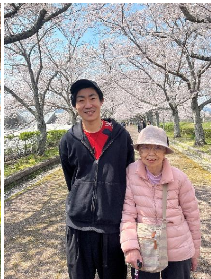
銅賞：『亀岡のおばあちゃん』