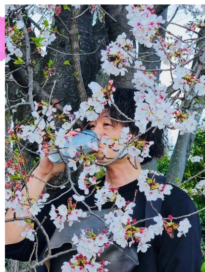
入選：『カンパイ!! with 鴨川の桜』